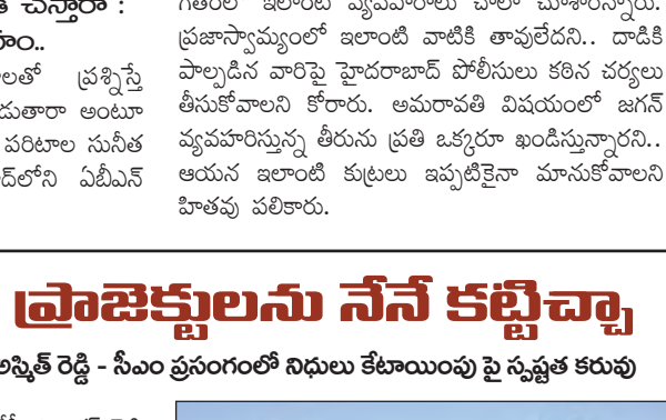
రెడ్డి మాట్లాడుతూ యాడికి కాలవ వ్యవస్థలో భాగంగా యాడికి కాలవ, చాగల్లు, పెండేకల్లు రిజర్వాయర్ల పరిధిలో 30 శాతం పనులు చేయాలి అంటూ చెప్పారు. వాటికి నిధులు అందుకోవాలని ప్రత్యేకంగా సీఎం చంద్రబాబు దృష్టికి తీసుకెళ్లారు. మా పెద్దవాన్ని దివాకర్ రెడ్డి ఎమ్మెల్యేగా ఉన్నప్పుడు యాడికి కాల్య పనులు, చాగల్లు, పెండేకల్లు.

వచ్చే సీఎం చంద్రబాబు, మాజీమంత్రి జేసీ దివాకర్ రెడ్డి మధ్య ఆసక్తికర సంభాషణ చోటుచేసుకున్నట్లు సమాచారం. 87 ఏళ్ల వయస్సులో ఇక్కడికి ఎందుకు వచ్చావు ? ఆరోగ్యం ఎలా ఉంది అంటూ సీఎం చంద్రబాబు మాజీ మంత్రి జేసీ దివాకర్ రెడ్డిని అప్యాయంగా పలక రించారు. ఆరోగ్యం బాగుందని చెబు తూనే తాడపత్రి నియోజకవర్గంలో యాడికి కాల్య వ్యవస్థలో భాగంగా చాగల్లు, పెండేకల్లు ప్రాజెక్టులను సీఎం మరల చెన్నా రెడ్డి ఉన్నప్పుడు నేనే కట్టే ందానని, వీటికి సంబంధించి మిగిలిపోయిన పనులను మీరు పూర్తి చేయాలని మాజీ మంత్రి జేసీ దివాకర్ రెడ్డి సీఎం ప్రత్యేకంగా కోరగా తన చర్యలు తీసుకుంటారని సీఎం చెప్పినట్లు తెలియ వచ్చింది. మాజీ ఎమ్మెల్యే జేసీ ప్రజలతో రెడ్డి, టీడీపీ యువ నాయకుడు జేసీ పవన్ రెడ్డి, ఎమ్మెల్యే అల్లం రెడ్డి లతో కలిసి మాజీ మంత్రి జే .సి .దివాకర్ రెడ్డి సీఎంతో భేటీ అయ్యారు.. కాగా యాడికి లోని ప్రజా వేదిక సభలో తాడపత్రి ఎమ్మెల్యే జేసీ ఆల్సెట్