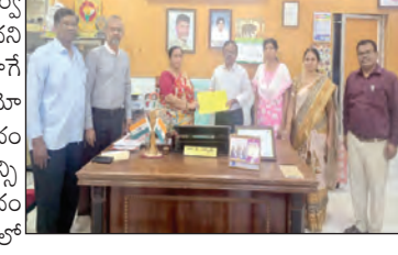
కళాశాలలో పర్యటిస్తున్న అకడమిక్ ఆడిట్ కమిటీ బృందం సభ్యులు