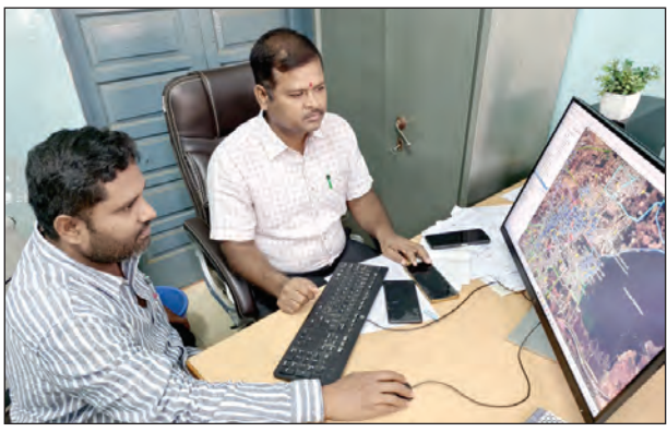
పునర్విజ్ఞాన పరిశీలిస్తున్న కమిషనర్