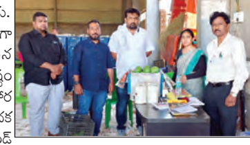
కల్యాణంలో ఎన్.కె.బి మామిడి మండి వద్ద తనిఖీలు నిర్వహిస్తున్న ఆహార భద్రతా అధికారులు

అధికారులు తెలిపారు. ప్రయోగశాల నివేదిక ప్రకారం మామిడి యజమానులపై కఠిన చర్యలు తీసుకుంటామని స్పష్టం చేశారు. అదేవిధంగా ఆహార భద్రతా ప్రమాణాలు పాటించడం పోషక విలువ ఉన్న సేపు అంద స్థానాల్లో పట్టం 2006 సెక్షన్ 31 కింద లైసెన్స్ పొందిన నాణ్యత జారీ చేసినట్లు వెల్లడిం చారు. ప్రజల ఆరోగ్యాన్ని కాపా డేందుకు జలాంటి తనిఖీలు నిరంతరం కొనసాగుతాయని అధికారులు హామిచ్చారు..