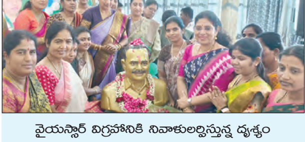
వైయస్సార్ విగ్రహానికి నివాళులర్పిస్తున్న దృశ్యం

- జిల్లా స్థాయి వైసిపి మహిళా విస్తృత సదస్సు