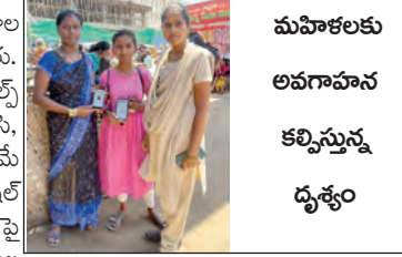
మహిళలకు అలగాహన కల్పిస్తున్న డ్యూటీ.

విద్యాసంస్థలు, కార్యాలయాల వద్ద గట్టి వెంటాట లన్నారు. మహిళల కోసం 24/7 హెల్ప్ లైన్ సేవలను బలోపేతం చేసి, చచ్చిన ఫిర్యాదులను తక్షణమే స్పందించాలన్నారు. సోషల్ మీడియా ఆన్లైన్ వేధింపులపై ప్రత్యేక నిఘా ఏర్పాటు చేయాల న్నారు. పాఠశాలలు, కళాశాల లు, గ్రామాలు, పట్టణాల్లో ఆవ గాహన కార్యక్రమాలు నిర్వహించి, మహిళలకు భద్రతను చైతన్యం కల్పించాలన్నారు. వుసరావుత నేరంపై ప్రత్యేక నిఘా ఉంచి, అవసరమైతే ఔం డోపర్ చర్యలు చేపట్టాలన్నారు.