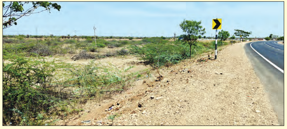
67వ జాతీయ రహదారి పక్కన రూ. 9 కోట్ల విలువైన ప్రభుత్వ భూమి