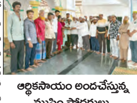
ఆర్థికసాయం అందచేస్తున్న ముస్లిం సోదరులు

లేవ్యాన్స్, ఏప్రిల్ 7 ప్రభాతవార్త అరుదైన ఎన్ఎంఐ టైమ్-2 వ్యాధిలో పోరాడుతున్న చిన్నాల్ కేయాన్స్ ను అదుకునేందుకు లేవ్యాన్స్ లోని ముస్లిం మైన్స్ సోదరులు ఉదారత చాటుకు న్నారు. తమ వంత సామాజిక బాధ్యత గా స్థానిక ముస్లింల చిన్నాల్ తల్లిదండ్రులకు 25 వేల రూపాయలను విరాళంగా అందజేశారు. చిన్నాల్ ప్రాణాలను కాపాడుకునేందుకు భారీ ఖర్చుతో కూడిన వైద్యం అవసరమని తెలుసుకున్న ముస్లిం సోదరులు ఈ విరాళాన్ని సేకరించి అందజేసినట్లు తెలిపారు. ఆపద సమయంలో తమను ఆదుకోవాలనే ముందుకు వచ్చిన ముస్లిం మైన్స్ సోదరులకు కేయాన్స్ కుటుంబసభ్యులు ఈ సందర్భంగా ప్రత్యేక కృతజ్ఞతలు తెలియజేశారు. తమ బిడ్డ కేయాన్స్ వ్యాధిలో ఉన్నట్లు అందగా నిలుస్తున్న ప్రతి ఒక్కరికీ వారు ధన్యవాదాలు తెలిపారు. ఈ కార్యక్రమంలో ముస్లిం సోదరులు, తదితరులు పాల్గొన్నారు.