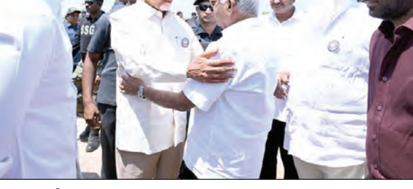
అనంతపురం, ఏప్రిల్ 7, (ప్రభాతవార్త బ్యూరో)

తాడపత్రి నియోజకవర్గం యాడికి మండల కేంద్రం గోమవారం రాష్ట్ర ముఖ్యమంత్రి నారా చంద్రబాబు నాయుడు వచ్చిన సందర్భంగా హెలికాప్టర్