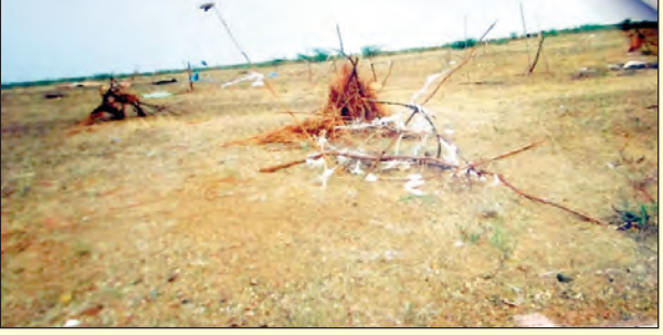
అన్యాయం కాకుండా 2016లోనే గుడిసెలు వేసిన ఎస్సీలు

యాడికి(తాడిపత్రి), ఏప్రిల్ 7, ప్రభాతవార్త ప్రభుత్వం ఓ వైపు భూ దండాలపై కఠిన చర్యలు తీసుకోవాలని ఆదేశిస్తున్నా.. క్షేత్రస్థాయి అధికారులు మాత్రం అవినీతికి అలవాటు పడి అక్రమార్కులకు కొమ్ము కాస్తున్నారు. ప్రభుత్వ భూములను కాపాడాలి నాలో కట్టడం అక్రమాల కనిపిస్తున్నా కట్టకట్టి వ్యవహరిస్తున్నారు. పట్టణ భూములను కొని వాటి పక్కనే ఉన్న ప్రభుత్వ భూములను కూడా కలిపేసుకునేలా పావులు కడిపిన వారికి అధికారులు పరోక్షంగా సహాయం చేస్తున్నారు. 22వ లో ఉన్న పట్టణ భూములను సడలింపు ప్రభుత్వం ఇచ్చిన వెనలట బాటును ప్రభుత్వ బంజరు భూమికి అన్యాయం చేలా కొందరు అధికారులు ప్రయత్నిస్తున్నట్లు తెలుస్తోంది. అక్రమార్కులు కాసులు సమర్పించుకుంటే చాలు కాని భూములను కూడా అధికారులు సమర్పిస్తున్నారనే వాదనలు వినిపిస్తున్నాయి. 67వ జాతీయ రహదారి పక్కన సుమారు రూ. 9 కోట్ల విలువైన 9.11 ఎకరాల ప్రభుత్వ బంజరును అన్యాయంతో చేసినందుకు కొందరు అధికారులు పావులు కడుపుతున్నట్లు సమాచారం. 2016 నుంచి ఎమ్మార్సీఎస్ నాయకులు అధ్యక్షులతో చేతులు వాచిన భూమిని అధికారంలోకి వచ్చిన వారికి అప్పగించేలా ఓ రెవెన్యూ అధికారి కీలక భూమికి పోషిస్తున్నట్లు ఆరోపణలు వినిపిస్తున్నాయి.